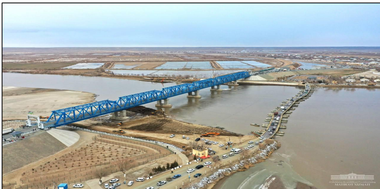
4-súwret. Ámiwdárya dáryası ústindegi kópir

Kópir eki tárepke qarap 24 jup poyezditi ótkeriw imkaniyatına iye bolıp, bul arqalı temir jol aralıǵı 180 kilometrge, júk tasıw tezligi bolsa 6 saatqa shekem qısqardı. Bul bolsa jergilikli júklerdenı tasıw kólemine 2 mártege, tasıw bahasını 2 esegge azaytıw imkanın berdi.